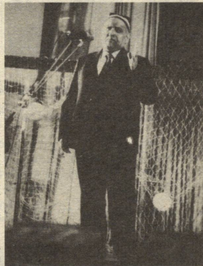
лимиз равнақига нечоғли ҳисса қўшганиги ва кушиб келатганининг гувоҳи бўламиз. Жураҳон ота қарийб 60 йилдан бунен Узбекистон футбол федерациясининг аъзоси, федерация ижрокумининг фахрий аъзоси.

— Аҳборжон уқа, кунга кеча мен Тошкент вилояти Янгиўул туманидаги «Халқобод» жамоа ҳужалигига бош директор этиб тайин-