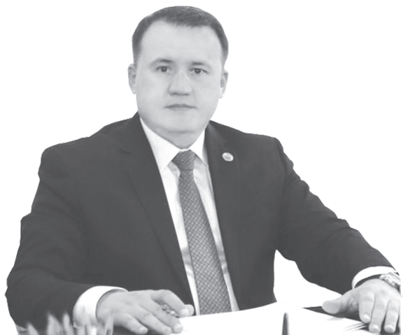
Актам ХАЙТОВ, Олий Мажлис Қонунчилик палатаси Спикери ўринбосари, O'zLiDeP фракцияси раҳбари

Лекин ҳозирги давр лицензиялаш ва рухсат бериш тартиб-таомилларини тубдан такомиллаштириш ҳамда бюрократик тўсиқларни бартараф этиш орқали тадбиркорлик субъектлари фаолияти учун янада кенг шарт-шароитларни яратишни тақозо этмоқда. Акс ҳолда, ортиқча бюрократия ва бошқа тўсиқлар сабаб