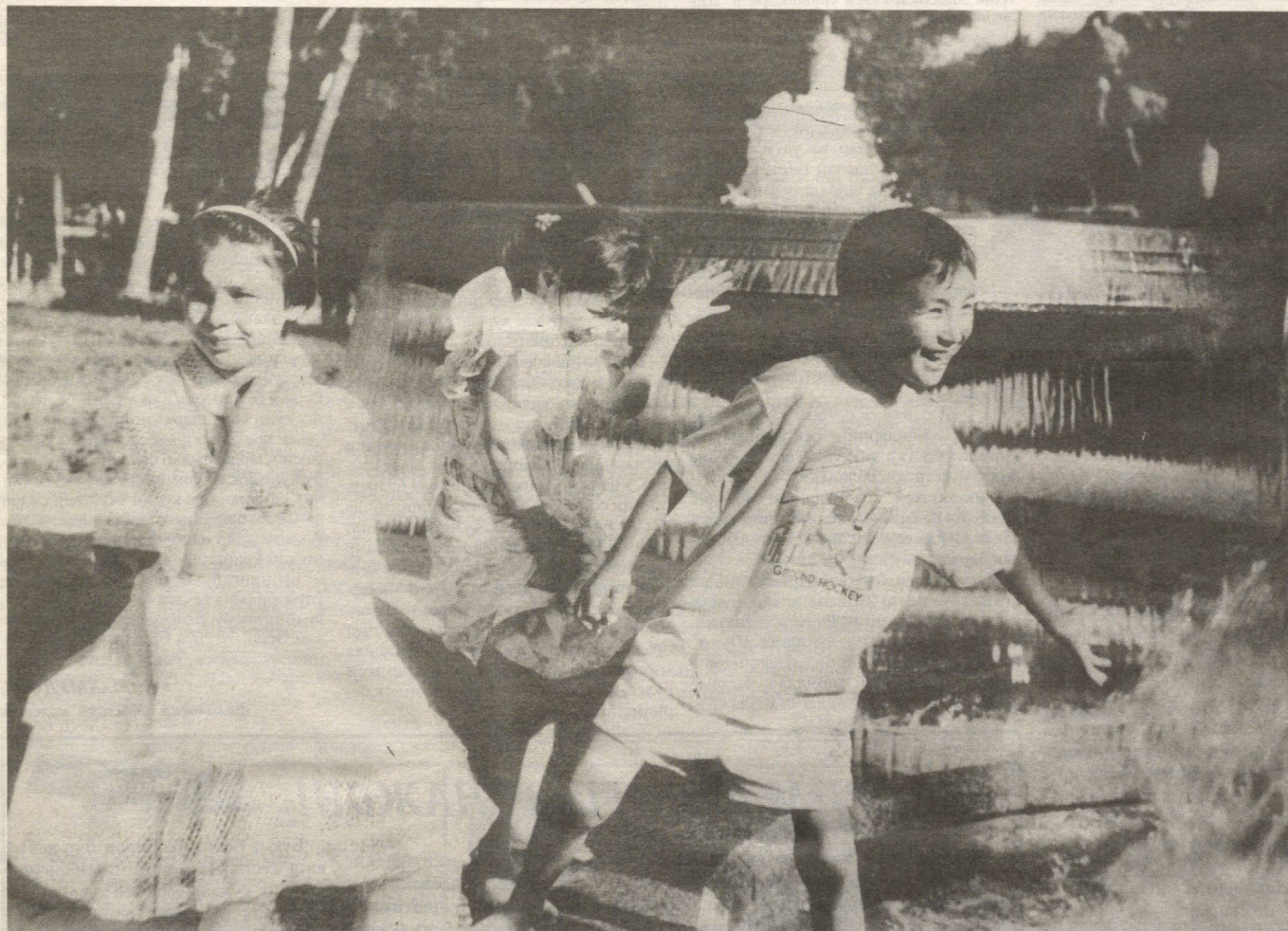
Ўйнашиб гоҳи табиатни қилайлик чоғлар

ЎзА ва республика матбуоти хабарлари асосида тайёрланди