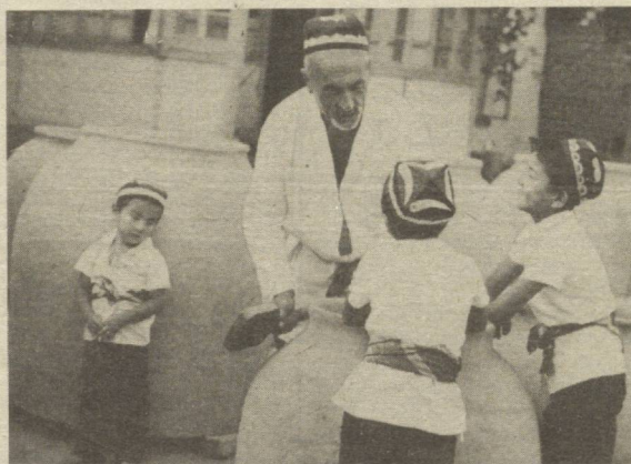
Уста ва шогирдлар