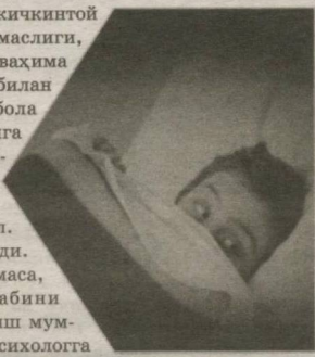
Ширинхон МҲМИНОВА тайёрлади.