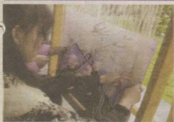
Игна ортидаги меҳнат ва... 2