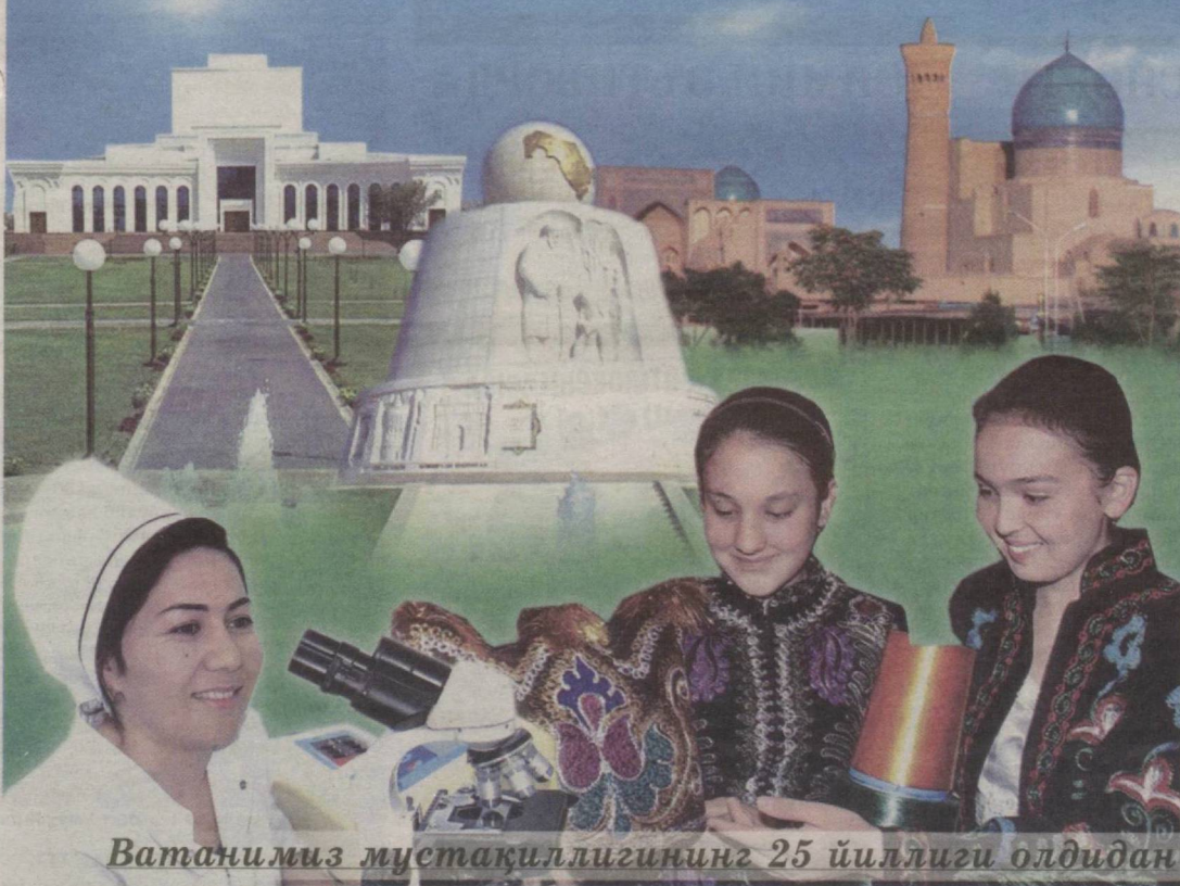
Ватанимиз мустақиллигининг 25 йиллиги олдидан