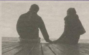
"Ўн саккизга 6 кирмаган мен бор..."