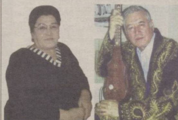
Бир-бирига ўхшаган ва... 4