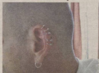
Зирак таққан... 8 йигитлар