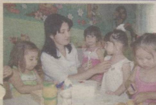
Бола иштиёқини 2 сўндирманг