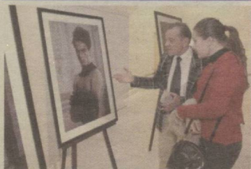
2 “Art Week Style.Uz —2011”