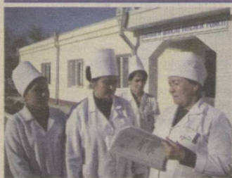
2 Қишлоқ шифокори