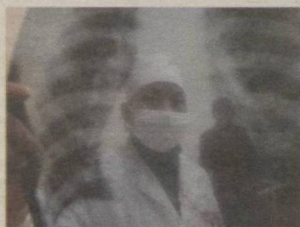
3 Сил хасталиги насл сурмайди