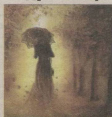
8 Кузакда тикилган дўппилар