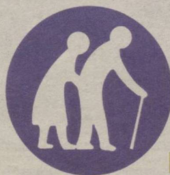
6 Сохта ногиронлик