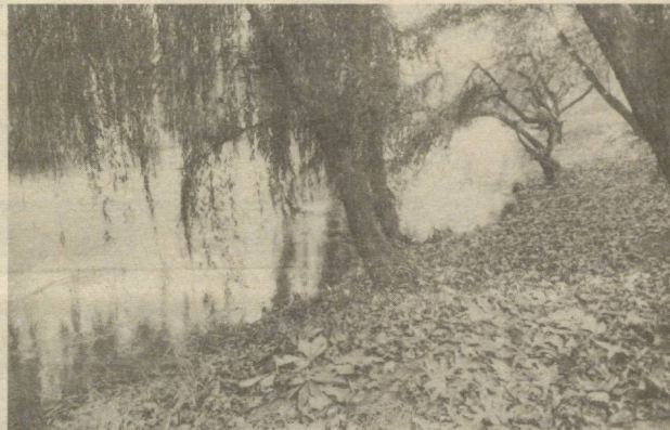
Жўнжиқиб қолдику дарахтлар