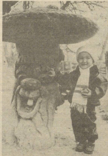
Ана энди қор ёғса ёғаверсин