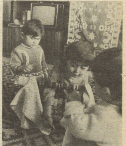
«Болалигим сени соғиндим»

Анганага кура йил охирилган сайин барча мамлакатларда ҳисоб-китоб, нарх-наво масаласида муайян ҳулосалар ясалади. Шу нуқтани назардан қараганда, утаётган 1997 йилда ҳам МДҲ мамлакатларида нарх-навонинг усийини тухта-тишга эришилгани йўқ. Хусусан, Россияда кейинги ойларида истеъмол баҳолари 0,2 фоиздан орғиб борган. Умуман олганда, Россиянинг ҳамма вилоят ва улқаларида нарх-наво бир хил эмас. Статистик маълумотларга қараганда, Россия Федерациясининг 75 субъектида озиқ-овқат маҳсулотлари нархи қисман арзонлашган бўлса, қолган ҳудудларида ошган. Кундалик газеталар 2 фоизга, уй телефонларининг абонент қўврилари уртгача 2,6 фоизга, кўватира туловлари 1,3 — 2,3 фоизга ошган.