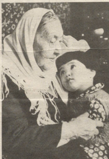
Ўригидан данаги ширин