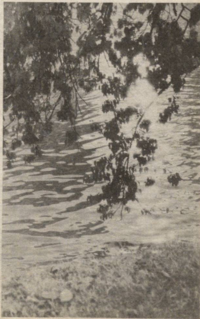
Раҳмон ҚОДИР тайёрлади

Бироқ улар Наполеоннинг Жозефинага бўлган муҳаббатини сундира олмади. Лекин у барибир хотини билан ажрашишга қарор қилди. Бунинг сабаби эса бошқа томонда эди: унга ўғил туғиб берадиган хотин керак эди. Ажралиш зарурлигини англаб етгач, унинг қалби яраланди, талоқ хатига имзо чекайтиб йиғлаб юборди. Ажрашгандан кейин у ую-ҳалга фарқ бўлиб, ҳеч кимни қургиси, ҳеч иш қилгиси келмай, уч кун уз қасрига қамалиб олди. Ана