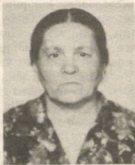
Мухтарома ойижонимиз ШАРСАҲОН ОНА!

Хорижий матбуот хабарлари асосида тайёрланди