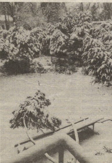
Қачон ёғар оппоқ қор

Болалар ва катталар ор-зиқиб кутган байрам — Янги йил қилиб келмоқда. Шу муносабат билан хонадонларда, муассаса ва ташкилотларда арча безатилади. Лекин бунда хавфсизлик қоидаларига эҳтибоб бўлиш керак. Ташкилотларда арча безатишда, байрамона кайфиятни бузувчи кўнгилсизликлар рўй бериши мумкин. Тошкент шаҳар Ҳамза