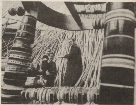
Бешиқда улғаяр келажак

«Оила ва жамият» газетасининг ҳар бир сонини ўқиб бораман. Унда қизиқарли, мазмунан раиғ-баранг мақолалар чоп этилгани учун ҳам ўқиб зерикмайсан киши. 49-сондаги «Билмайин босдим тиканини» сарлавхали мақолани ўқиб, бир жиҳати Хуршида ҳам, Зебога ҳам ачинадми. Еш бошларига шунча ташвиш, гам тулибди. Лекин иккови ҳиссиёлари берилиб, муҳаббат, ҳаё, номус отли чинни пиеллага дарз туширганлари чакки бўлибди.