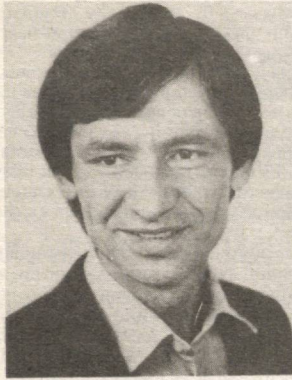
Мухаммад ЮСУФ шеърятимиз осмонининг энг катта юлдузларидан.

У бадий тўқималар, шаклий устозларнинг курсатмади. Лекин ўзбекнинг феъл-атворини, дарду-орзуларини кўтариб чиқди ва эл орасида севили бўлди. Улаб китоб чиқариб, ҳали ҳеч ким танимайдиган, лекин юрт танишини чин кўнгилдан истаган ишодкорлар ёзишни, улус кўксига бош қўйишни Мухаммад Юсуфдан ўрганиши лозим. Зеро, халқнинг муҳаббатига ҳақиқий баҳо, ҳақиқий муҳаббатидир.