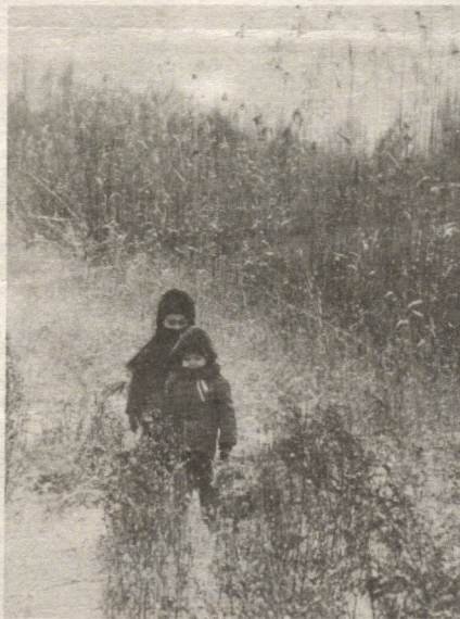
—Хув тоғдан-чи, Қорбобо келармикан?