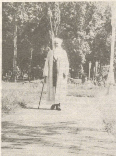
Шу кунларга етказганига шукур!

Яна бир барчаларингизни, Рамазони шариф ила муборакбод этаман. Аллоҳ таоло бу ойда тутадиган рузаларимизни ва қиладиган тоат-ибодат ва дуоларимизни уз даргоҳида ҳусни қабул айлаб, барча оилаларга бахт-саодат, тинчлик-хотиржалик истаб, келгуси моҳи Рамазонга бағри бутунликда етиб боришимизни сураб, дуо қилиб қоламан.