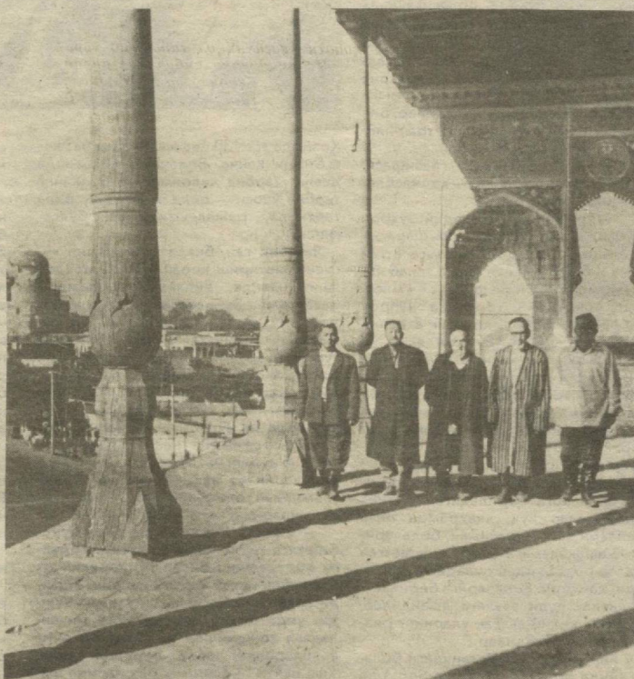
АФРОСИЁБ БАЛАНДЛИГИДАН ЭСТАЛИК

Эслатиб ўтамиз: 1993 йил учун тўлиқ обуна бўлганлар хонадонига «Оила ва жамият» 1 июнгача боради. Феврал, март, апрел ойларидан бошлаб обуна бўлганлар эса газетни тегишли равишда биринчи... июл, август, сентябргача олишади. Май ойидан эса янги баҳода обуна бошланди. Азиз мухлислар! Севибли газетингизга обуна бўлишини унутманг!