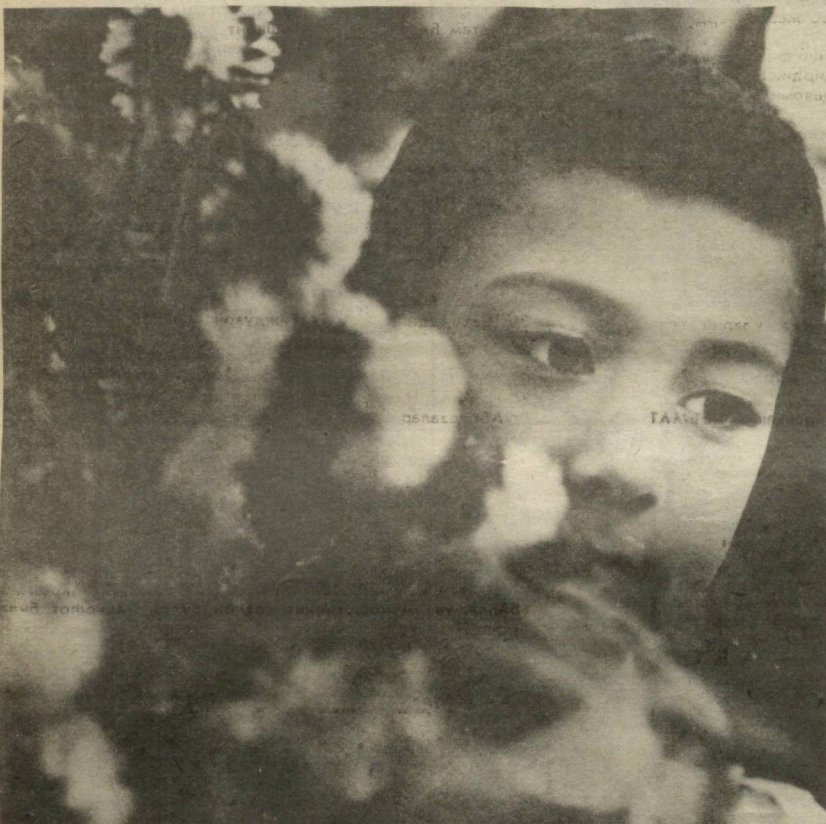
ГУЛЛАР ОРТИДАГИ ХАЁЛ