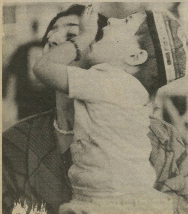
— ОҲ, УЙҚУ БИРАМ ШИРИН