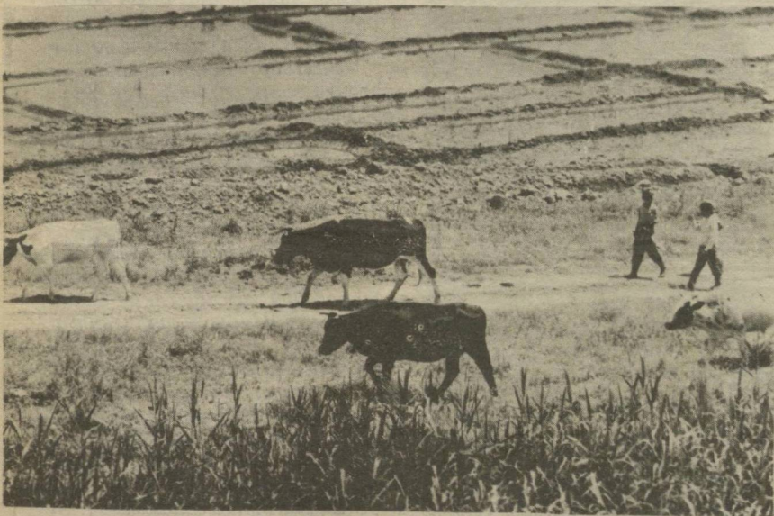
МЕН СИЗНИ СЕВАМАН, БОЛАЛАР, МЕН СИЗНИ СЕВАМАН, ДАЛАЛАР...