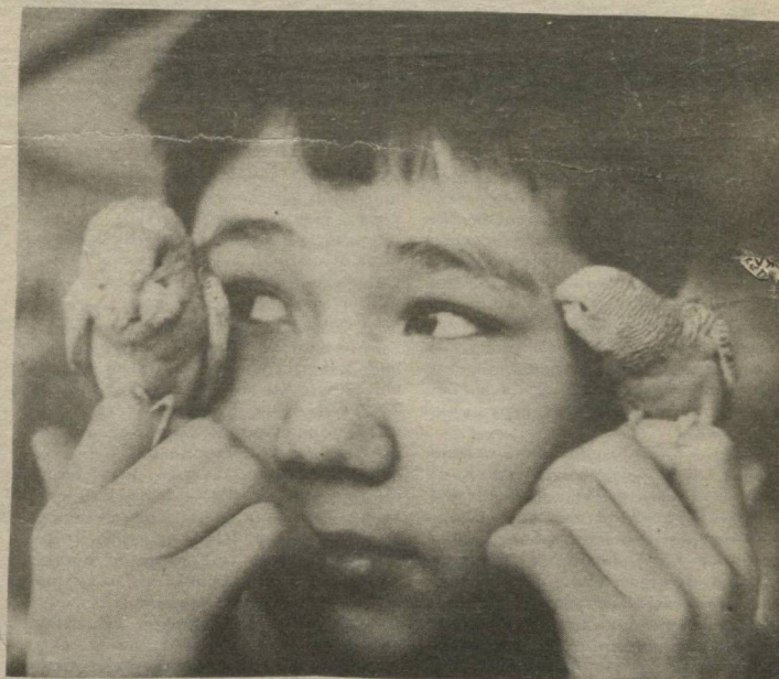
ҚУШЛАР БИЛАН ТИЛЛАШИБ

шиғохонларимиз йўқ. Касалхоналарда дори-дармонлар, малакали шиғо-кор хизмати етишмайди. Исталган дори-риларни вақтда топиш қийин. Бундай ҳолда пулли даволашни жорий қилиш беморнинг ҳўнтагини шиллишдан бошқа нарса эмас. Назаримда, пулли шиғохонларни ташкил қилишда АҚШ тажрибаси бирмунча мақбул. Уларда Қизил Хоч жамиятига қарашли