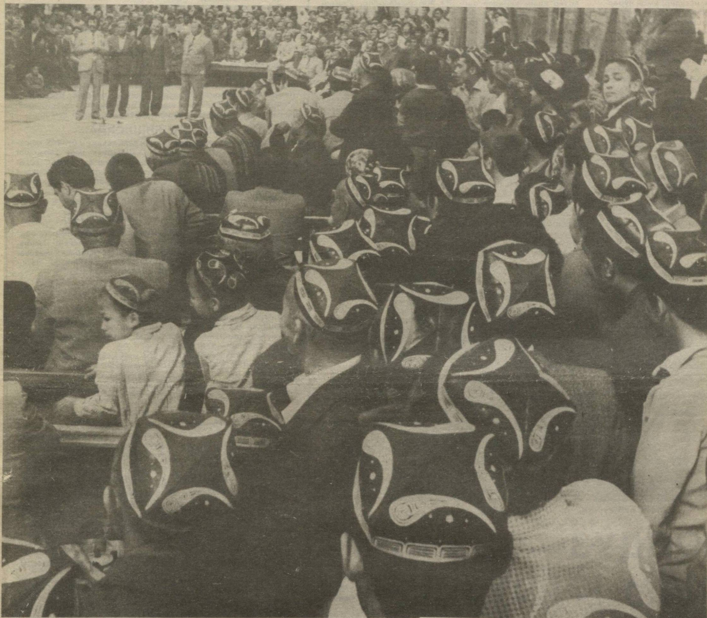
КАТТА БАЙРАМ КЕЛЯПТИ!