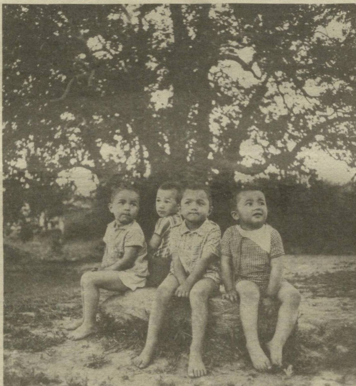
БОЛАЛАРНИНГ КЎЗЛАРИ УТКИР, ТИКИЛСА КЕЛАЖАКНИ КЎРАДИ...

Ҳазрати Али розиёллоҳу анҳунинг Расули Акрам саллоллоҳу алайҳи ва салламдан ривоят қилишича, Аллоҳи таоло шундай буюрмишди: [Ла илаҳа иллоллоҳ] калиман шаҳодати менинг қалъамдир. Қалъамга кирган азобимдан омон қолади. «Кулим менинг ҳузуримга бир дунё гуноҳ билан келса ҳам, менга ширк қўшмаган бўлса, уни бир дунё мағфират билан қарши оламан». «Мўъмин кулим менга баъзи фаришталардан кўра ҳам севимлироқдир».