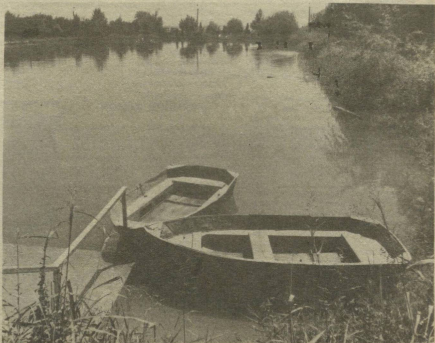
ДАРЕ МАВЖЛАРИГА ЕЗИЛМИШ ҒАЗАЛ...