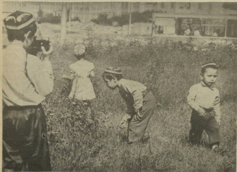
ВОЙ, ЖУДА ЧИРОЙЛИ КАПАЛАК ЭДИ-Я!