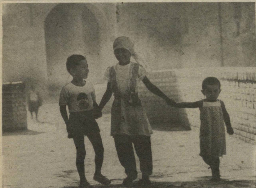
— БИЗ ШУНДАЙМИЗ

МУХБИРЛАРИМИЗ ХАБАРЛАРИ АСОСИДА ТАЙЕРЛАНДИ