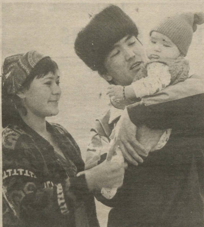
МУСАФФО КУЛГУ, МУСАФФО ҚАЛБ, МУСАФФО БОЛАЛИК...