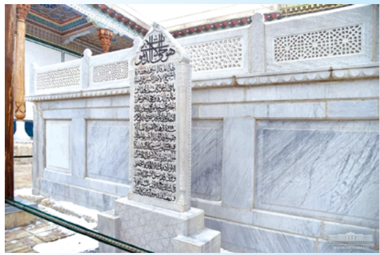
Президент Шавкат Мирзиёев 22 январь куни эрта тонгда Баҳоуддин Нақшбанд мақбарасини зиёрат қилди.

Ўзбекистон касаба уюшмалари Федерацияси нашри • Газета 1991 йил 21 мартдан чиқа бошлаган • www.ishonch.uz • e-mail: ishonch1991@yandex.uz