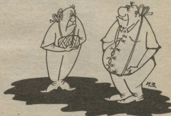
Муаллиф: Илҳом ЗОИР