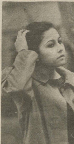
— Ким у? — Эшикни очинг, бу мен Қизил қалпоқчаман,— дебди Бўри.— Мен сизга гўштли бўғирсоқ ва вино олиб

Қишлоқдан ярим чақирим келадиган масофада, ўрмон ичида қизалоқнинг бувиси яшар экан. Ўрмон ичига кирган заҳотиёқ Қизил қалпоқча олдида бўри чиқибди. Қизил қалпоқча бўрининг йиртқичлиги ва конхўрлиги-