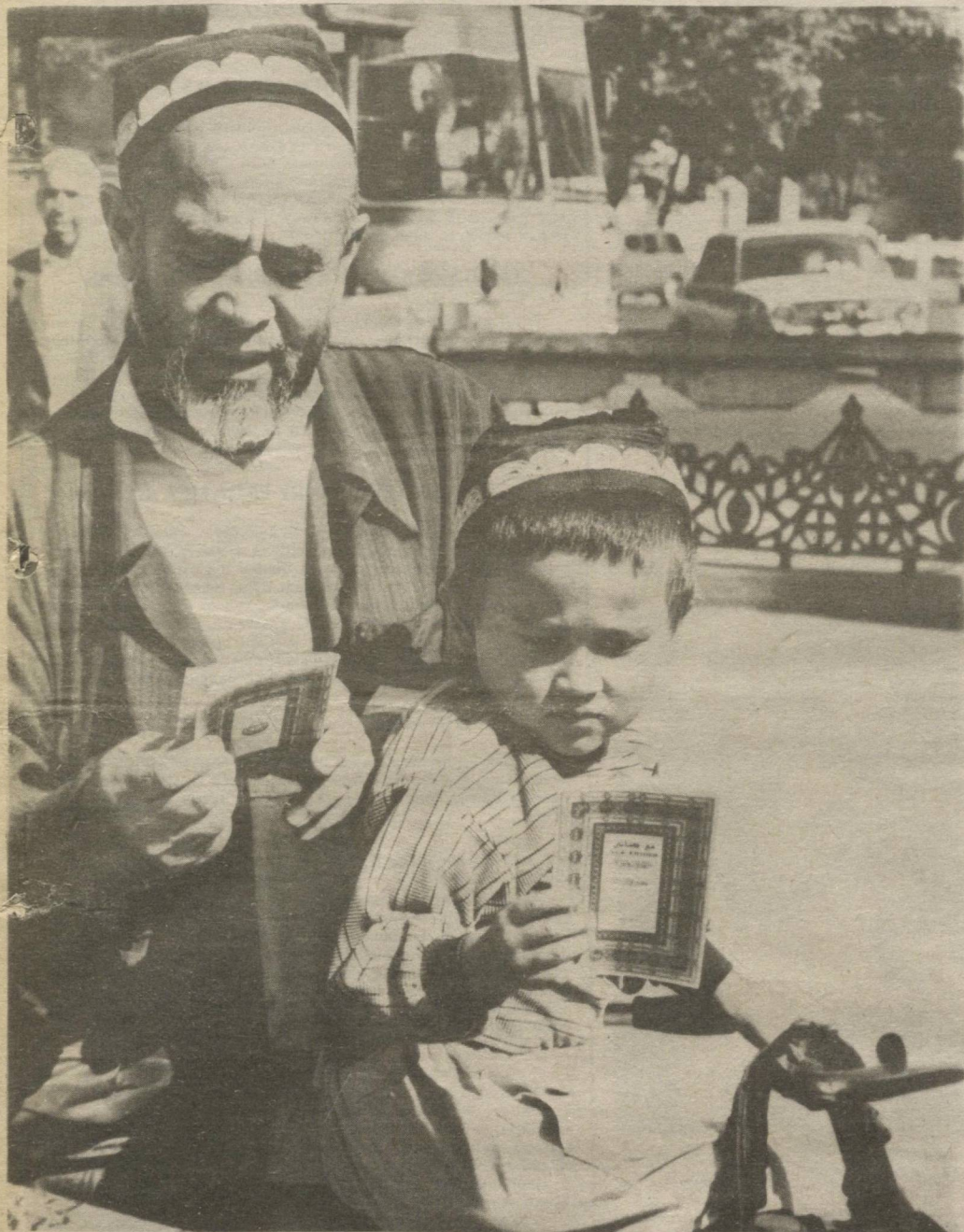
БИЗ ОРЗУ ҚИЛГАН КИТОБЛАР