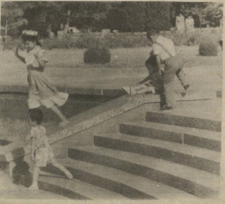
Собит МУСАЕВ сурати

— Сиз энг ёқтирган нарса нима! Сиз учун қай маҳал ором олиш кўнгиллироқ!