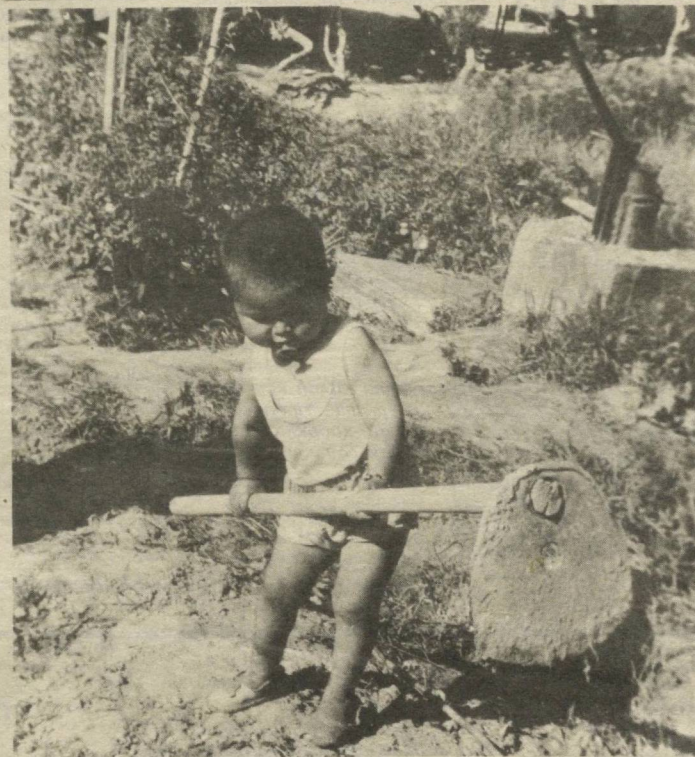
«ОББО, БОЛАКАЙ — ЭИ!..»

«Бир яхшилик қилганга унинг ўн мисли ёки яна ҳам кўпроги баробарида яхшилик билан жавоб берилади ёхуд мағфират этман. Менга бир қарчи яқинлашганга мен бир аршин ва бир аршин яқинлашганга беш қулоч яқинлашман. Бир кимса менга юриб келадиган бўлса, мен унга юзуриб келаман. Менга шерик қўшманган, куфр этманган бир одам бутун ер юзини қоплагудек гуноҳ билан менга қовушса, мен у одамни йианчалик мағфират билан қарши оламан».