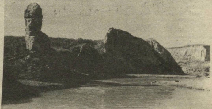
Х. МИРЗАКАРИМОВ сурати