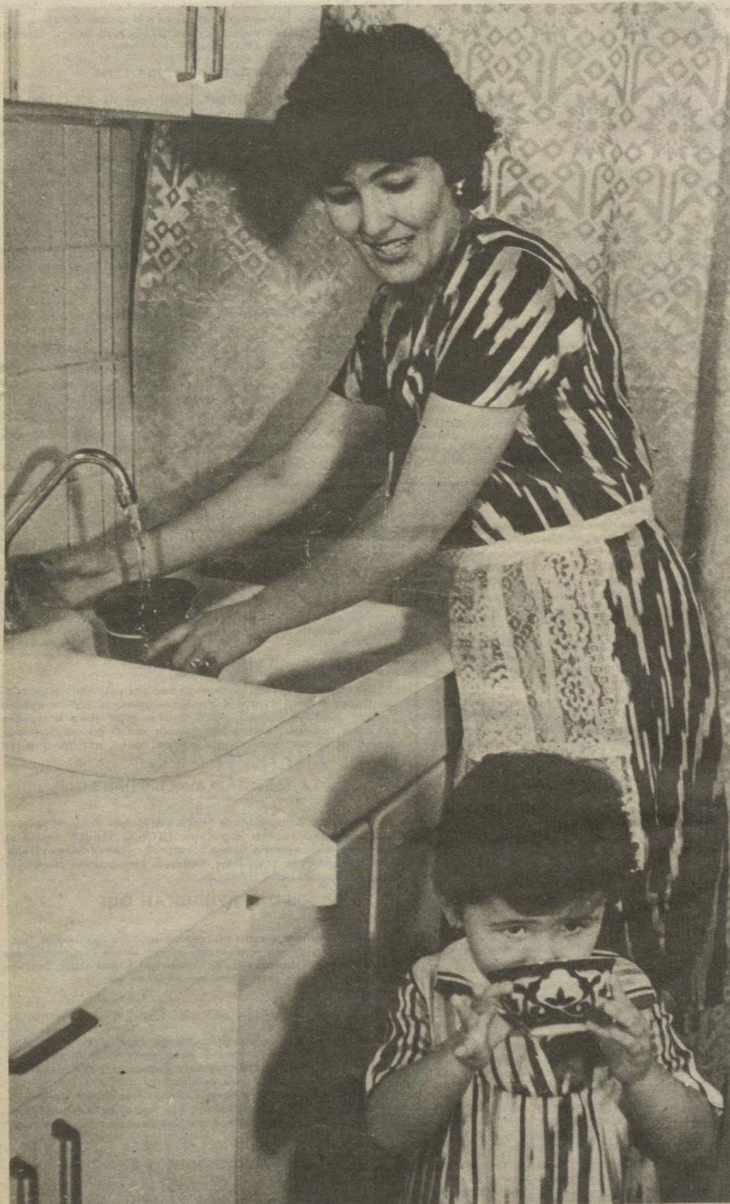
ОНАСИ ВА ОНА-ҚИЗ