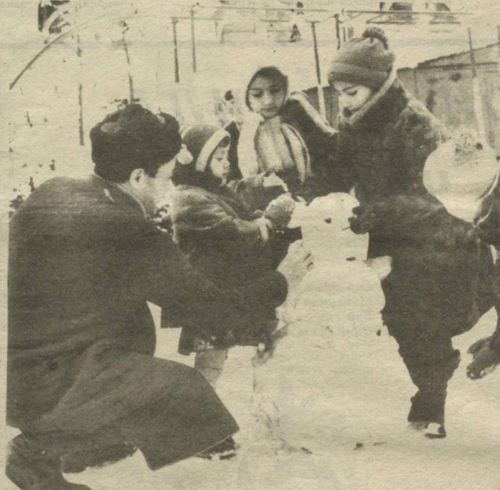
ЭРИМАЙ ТУРСАНГ БУЛГАНИ

Сирдарё вилоятилик, биргина ширин қизи бўлган Тошкент шаҳрида ўз шахсий уйда яшовчи, оиланинг барча ишларига ўқувчи, ёқим-тойгина аёл, 45 ёшгача бўлган, меҳрибон, ичмайдиган, бамаъни киши билан турмуш кўрмоқчи. Хоҳиш билдирганлар унинг 2 хонали уйига кўчиб ўтсалар нур устига аъло нур. «Оила-271».