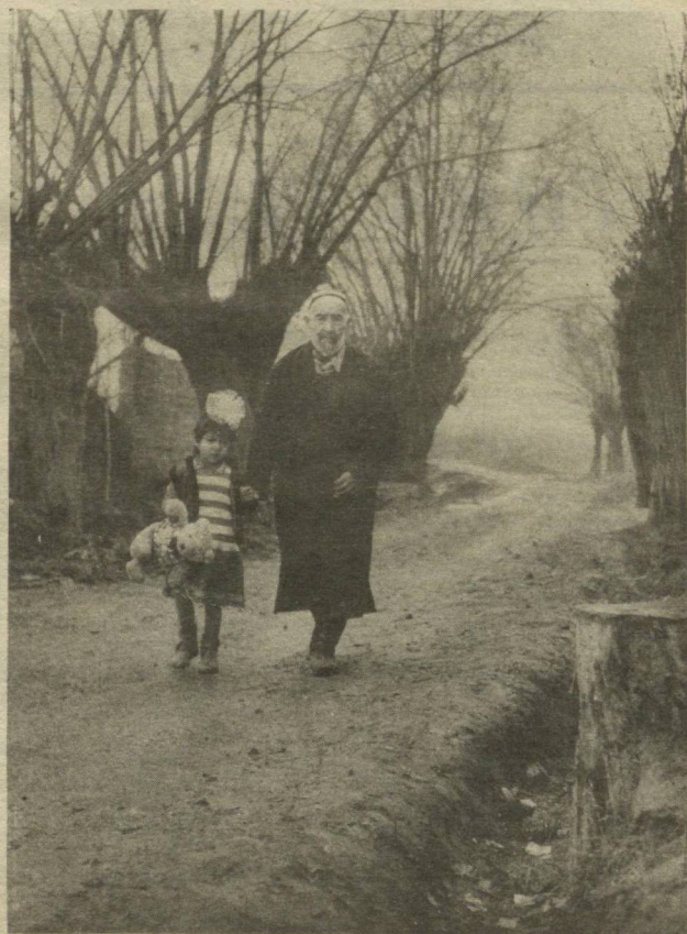
БОБОЛАРНИНГ УЗИ БИР ҲИКМАТ

Мискин Хожа Аҳмад жони ҳам гавҳардур ҳам қони, Жумла онинг макони, ул ломакон ичинда.