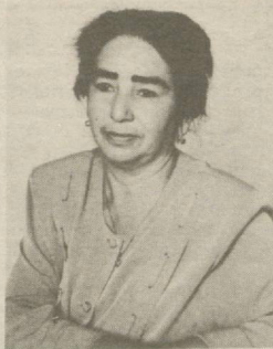
Гул узиб этдинг гуноҳ сен ўзингсан, сен ўзинг.

Кўзларимдан кетмиш уйку, дилда ўтти эҳтирос, Ишқу оташга гувоҳ сен ўзингсан, сен ўзинг.