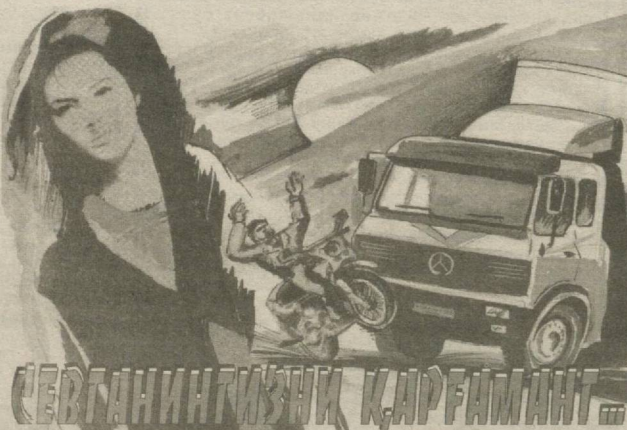
СЕВГАННИНГ ҚИЗНИ ҚАРМАМАНГ

тоциклига ўтириб йўлга қараш ўрнига менга қараб турганда даҳшатли воқеа юз берди. Каттакон машина тагида менинг Отабегим ётарди. Кўзим олдида бўлди бу иш. Бир муддат тош бўлиб қотиб қолибман, ўзимга келиб у томон югуриб бордим, атроф тўла қон эди. Милиция, тез ёрдам етиб келди. Уни касалхонага олиб кетишди. Шу орада дўстларим етиб келишди, кўнглимни кўтариб ҳеч нарса қилмайдди деб айтишди.