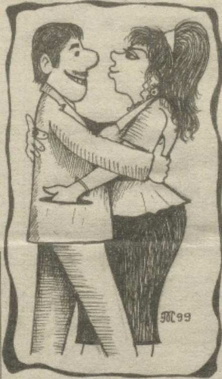
Изоҳга ҳоҷат йўқ...

"Муштум" якка тартибда - 842, ташкилотлар - 843 "Афанди" якка тартибда - 590, ташкилотлар - 591