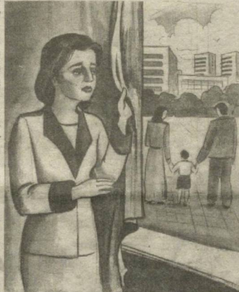
"Бу дарддан қутулиб бўлармикан?" - 48-сон