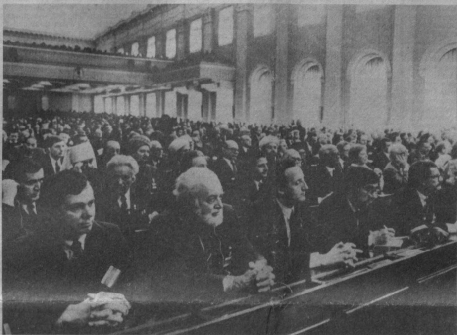
Во время встречи.