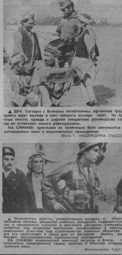
▲ ДРА. Сегодня с большим нетерпением афганские трудящиеся ждут выхода в свет каждого номера газет. Их протестные тексты, правда о каждой инициативе руководства страны не оставляют никого равнодушными. ▲ НА СНИМКЕ: крестьяне из провинции Балх знакомятся с материалами газет о национальном примирении. ▲ Незаконные аресты, унижительные допросы и обыски, массовые облавы, закрытие учебных заведений, коммюнистический час в населенных пунктах и жестокие расправы озверевшей солдатки над мирными жителями, конфискация у крестьян земельных участков под строительство военных объектов — все это происходит в наши дни на Западном берегу реки Иордан, оккупированном израильской военщиной. ▲ НА СНИМКЕ: израильский военный патруль в Влате, где оккупанты предприняли серию арестов и обысков «подозрительных» лиц.