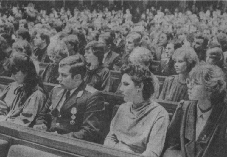
активно включаются трудовые коллективы.

ТАЛЛИН, 20 февраля. (ТАСС). Генеральный секретарь ЦК КПСС М. С. Горбачев продолжает зна-