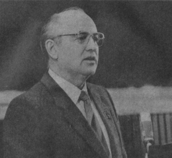
Выступление М. С. Горбачева на XX съезде комсомола Эстонии.

ТАЛЛИН, 20 февраля. (ТАСС). Генеральный секретарь ЦК КПСС М. С. Горбачев продолжает зна-