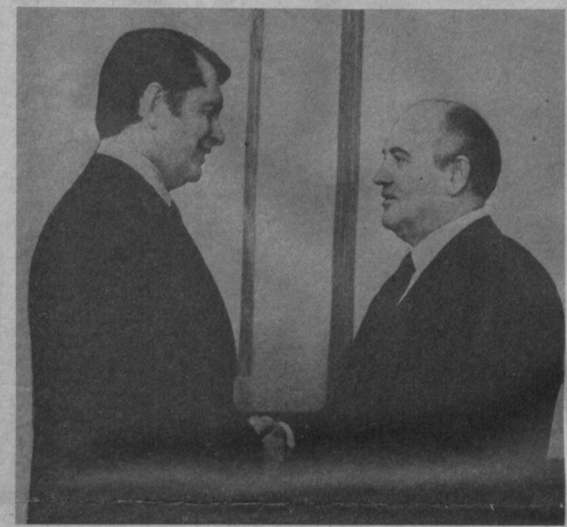
Перед началом беседы.