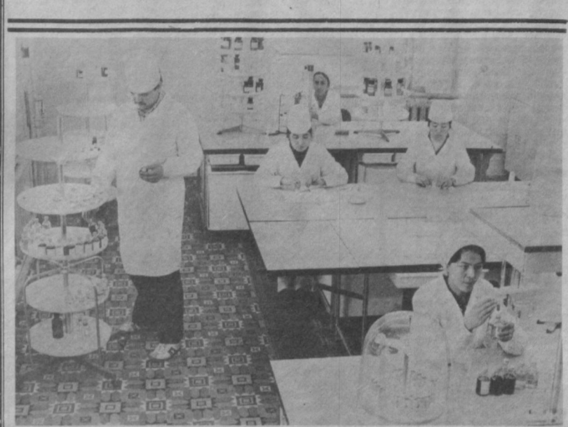
НА СТРАЖЕ ЗДОРОВЬЯ

НАМАНГАНСКАЯ ОБЛАСТЬ. Новая аптека открывает в Касансайском районе. Она осуществляет централизованную поставку медикаментов в восемь сельских аптек. Необходимое лекарство здесь можно заказать и по телефону. Ветеранам войны и труда специальная выездная служба доставляет препараты на дом. Новая аптека построена по заказам избирателей.