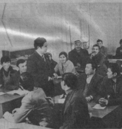
Менее года существует общественно-политический центр в колхозе «Москва» Чартакского района Наманганской области, но работа его уже ошущима. Здесь действует школа экономической учебы, проводятся занятия по агитационной пропаганде, различные мероприятия, организуемые партийным и комсомольским комитетами.

Книга выпущена Издательством политической литературы. (ТАСС).