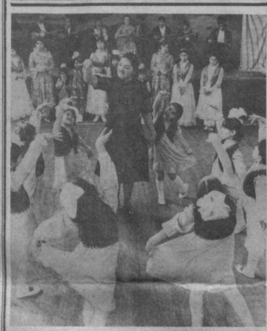
Ансамбль «Лягуш» хивинского детского сада «Бойчечани» — самый юный коллектив в области — участвует во втором Всесоюзном фестивале народного творчества, посвященном 70-летию Великого Октября.