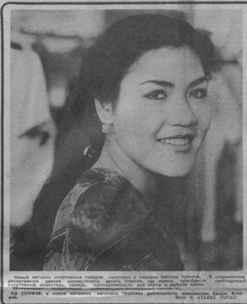
Новый магазин спортивных товаров получили в подарок жители Ургенча. В современном двухэтажном здании разместились десять отделов, где можно приобрести необходимый спортивный инвентарь, одежду, принадлежности для охоты и рыбной ловли.

На своем съезде женщины Узбекистана еще раз с большой решимостью заявят о своем стремлении вести неустанную борьбу за мир во всем мире, искренне желая жить в мире, дружбе и взаимопонимании со всеми народами земли.