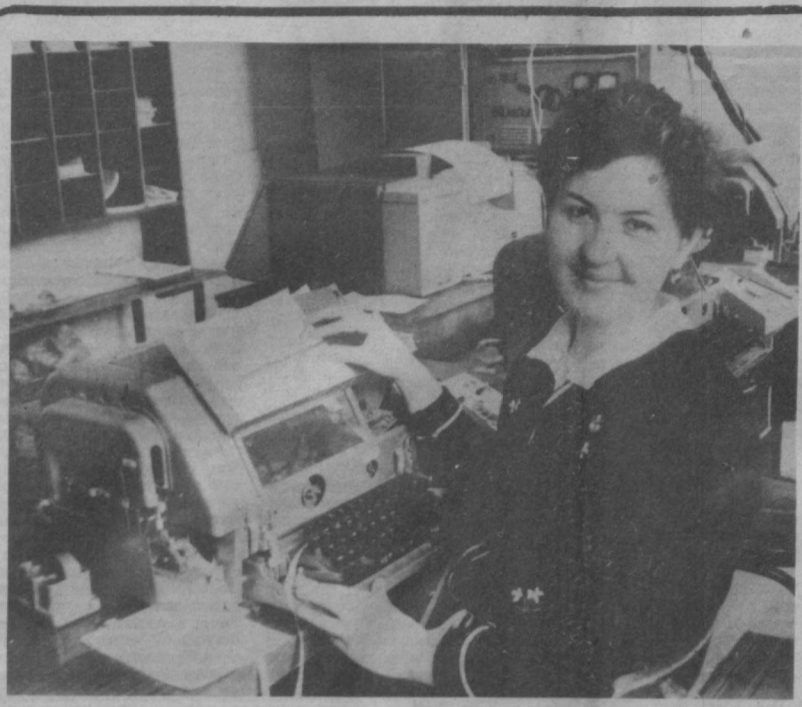
Г. Кадырова работает телеграфисткой 300 телеграмма всех видов, гарантируя высокое качество работы.