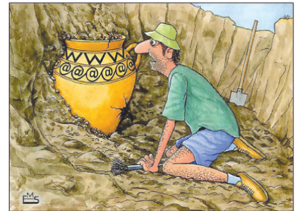
Махмуджон Эшонқулов чизган сурат.