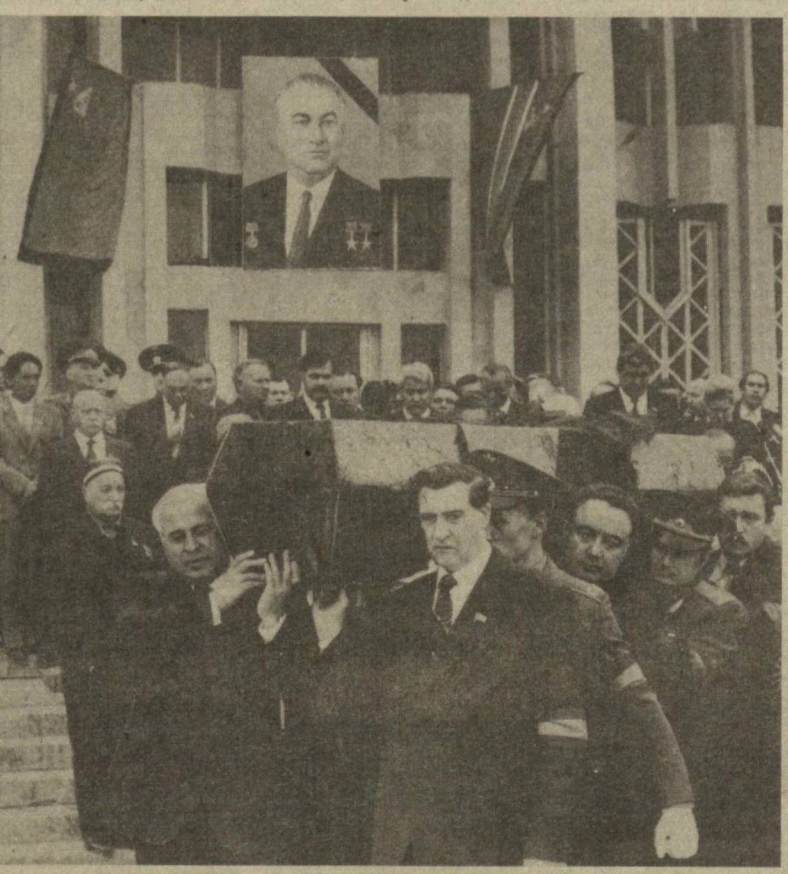
На площади Дружбы народов СССР.