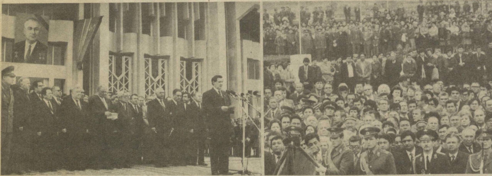
Траурный митинг, посвященный памяти Ш. Р. Рашидова.