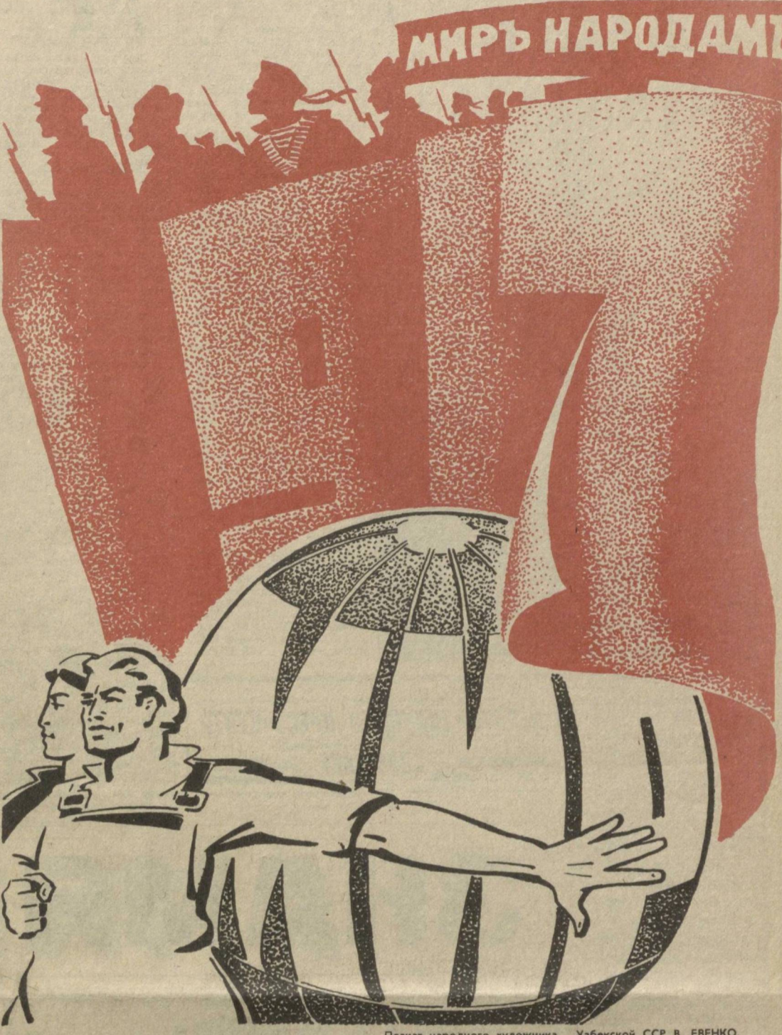
Плакат народного художника Узбекской ССР В. ЕВЕНКО.

И в кумачовых стягах, которые реют сегодня над колоннами массовых народных демонстраций, в неразрывной единстве начертаны гордые слова: «Ленин», «КПСС», «Октябрь», «Мир планете Земля!».