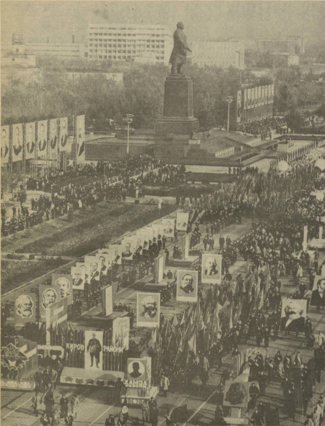
Ташкент, 7 ноября 1983 года. Демонстрация трудящихся на площади имени В. И. Ленина.