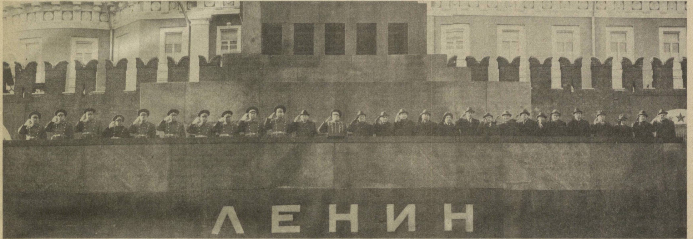
Москва, Красная площадь, 7 ноября 1983 года. На трибуне Мавзолея В. И. Ленина.

Советский народ еще раз подтвердил свое стремление теснее сплотиться вокруг Коммунистической партии и ее Центрального Комитета, успешно претворить в жизнь исторические предназначения XXVI съезда партии.