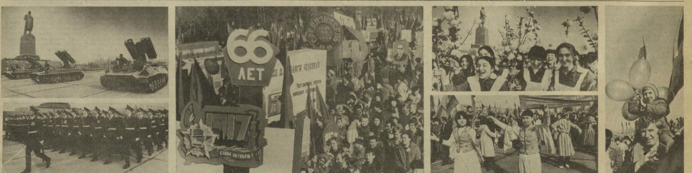
Ташкент. 7 ноября 1983 года. Парад войск и демонстрация трудящихся на площади имени В. И. Ленина.

Репортаж с Красной площади корреспонденту ТАСС А. БЕЛИКОВ, М. БОРОДИНА, В. ДИЛАЛОВ, О. МОСКОВСКИЙ, С. МУТОВНИН, А. СИВЦОВ.