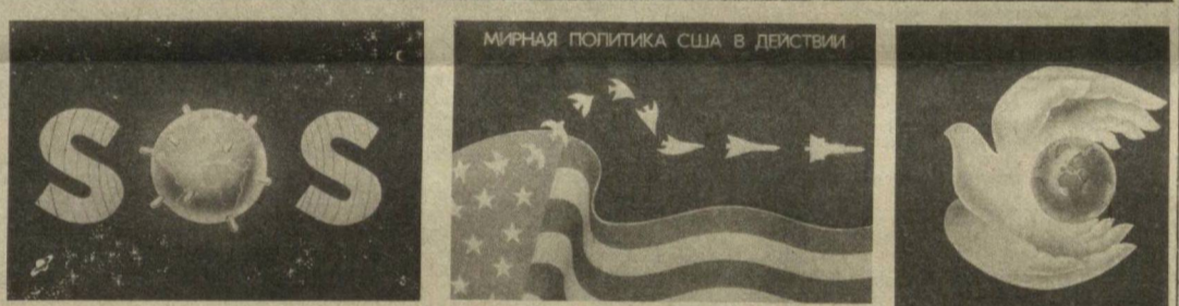
Мирная политика США в действии