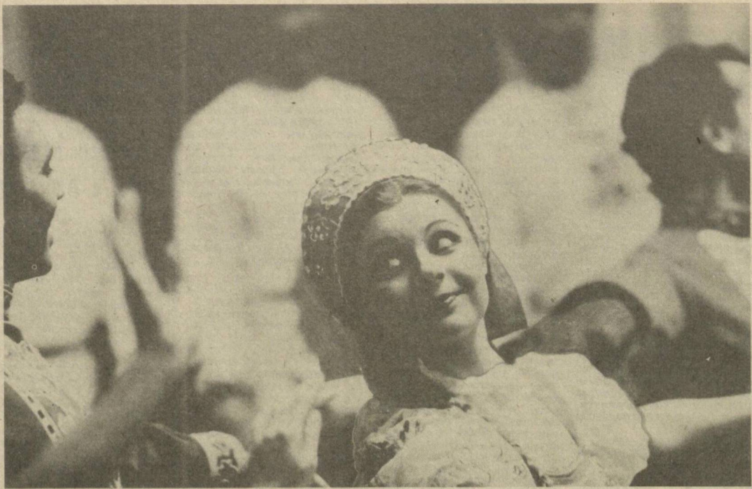
Русский перепляс. (Снимок сделан во время недавних гастролей в Ташкенте Государственного академического русского народного хора РСФСР имени М. Е. Пятницкого).