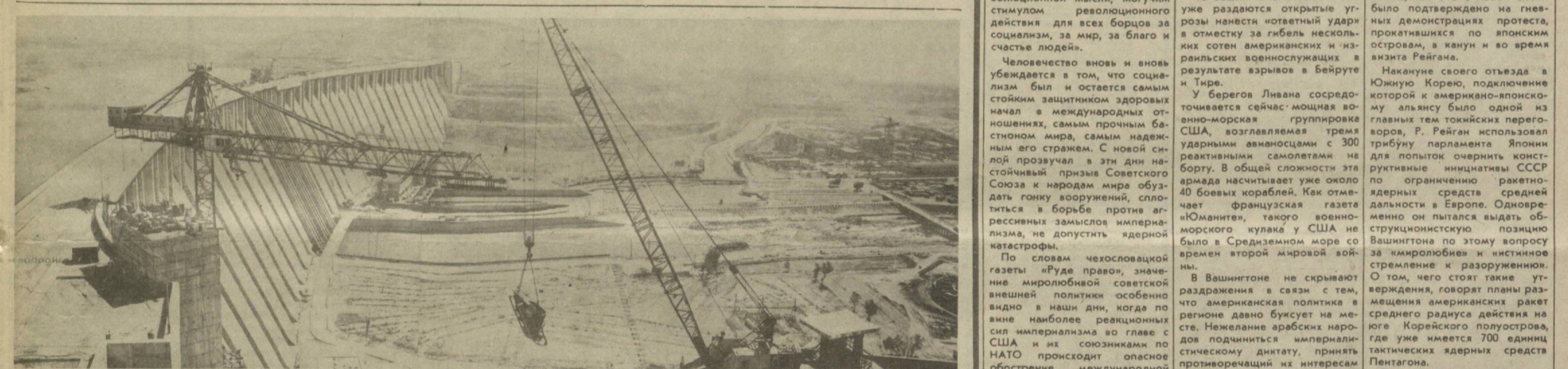
Полмиллиона гектаров пашни хозяйства Андижанского и Ферганской областей Узбекистана, а также Омской области Иркутской орошается за сезон массовых поливов водными руноотводными системами. В комплексе водохранилища возводятся гидростанция, электростанция, управление. Сейчас трунами управляют «Андижангидрострой» форсируют работы на энергетическом объекте. Два первых агрегата здесь уже пущены и дают ток. До конца года намечено ввести в строй еще два. В общей сложности они будут вырабатывать 140 тысяч киловатт электроэнергии, которая пойдет в Единую энергосистему Средней Азии. На снимке: общин вид плотины Андижанского водохранилища. Фото К. ТАШПУЛОВА (УзТАП).

дают ток. До конца года намечено ввести в строй еще два. В общей сложности они будут вырабатывать 140 тысяч киловатт электроэнергии, которая пойдет в Единую энергосистему Средней Азии. На снимке: общин вид плотины Андижанского водохранилища. Фото К. ТАШПУЛОВА (УзТАП).