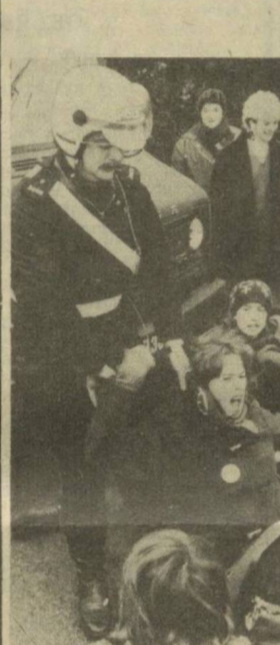
В ОДИН из первых сентябрьских дней на американской военно-воздушной базе Рамштейн в Западной Германии на церемонии, посвященной началу военных маневров «Отач форду» — «Осенняя куница», выступили генеральный секретарь Североатлантического блока Лунс и верховный главнокомандующий объединенными вооруженными силами НАТО в Европе американский генерал Роджерс. Речи этих двух милитаристов были посвящены не только учениям, нацеленным на подготовку к войне атлантических армий, но и... накануне за мир, а точнее — накануне на участников этого великого движения современности, на людей, олицетворяющих совесть человечества. Лунс договорился до клеветнического утверждения о том, будто выступающие против размещения в Западной Европе новых американских ядерных ракет «способствуют войне».

В НОЯБРЕ 1982 года на Пленуме ЦК КПСС товарищ Ю. В. Андропов отметил: «Ныне на авансцену истории, как никогда ранее, выходят народы. Они обрели право голоса, который никому не заглушить. Они спонтанно активными и целенаправленными действиями устраняют угрозу ядерной войны, оберег мир, а значит, и жизнь на нашей планете». В самом деле, антивоенное движение, которое обрело невиданные в истории массовость и размах, со всей решительностью заявило о себе как о мощной силе, оказывающей серьезное воздействие на общественно-политическую жизнь как в отдельных странах, так и в мире в целом. Достаточно напомнить о том, что против размещения новых ядерных ракет в ФРГ выступают 75 процентов граждан этой страны, а под Крестфельдским воззванием, этим документом мира, поставили свои подписи 4,7 миллиона человек. Под воздействием антивоенных движений правительства Бельгии и Голландии так и не приняла официального решения по вопросу о размещении в их странах крылатых ракет. Парламент Дании проголосовал против выделение средств в счет «долевого участия» для развертывания американских ракет. Правительство