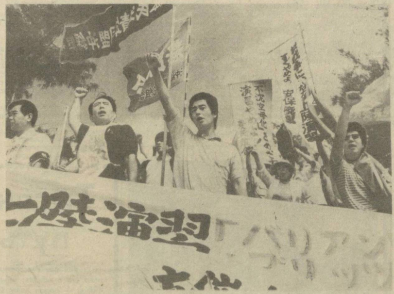
Сотни японских борцов за мир (на снимке) собрались у американского полигона Калм-Хансен в северной части острова Окинава. Они протестуют против проведения подразделениями морской пехоты США очередных артиллерийских стрельб. Со времени возвраще-

ния Японии в 1972 году административных прав на Окинаву подобные учения, как отмечает агентство Киодо, проводятся уже в 35 раз и постоянно угрожают безопасности населения.