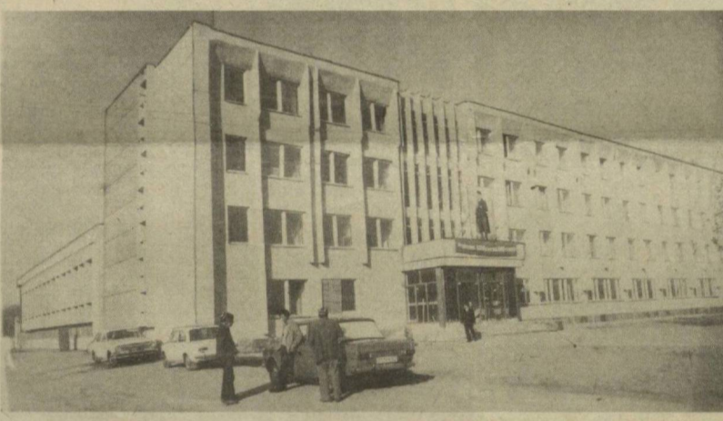
С вводом в строй в Марши новой типографии производственных мощностей полиграфии Кашкадарьинской области достигли 36 млн. листов-оттисков в год. Вместе с полграфистами новую полику получили редакции областных газет «Кашкадарьинская» и «Кашкадарьинская правда». Построенный по специальному проекту полиграфический комплекс позволил организовать технологический процесс с учетом современных отечественных и зарубежных достижений.

С. МОРОЗОВ. Корр. спеццентра Минмонтажспецстроя Узбекской ССР.