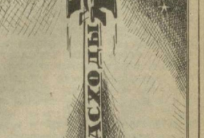
Рис. В. МУРОМЦЕВА.