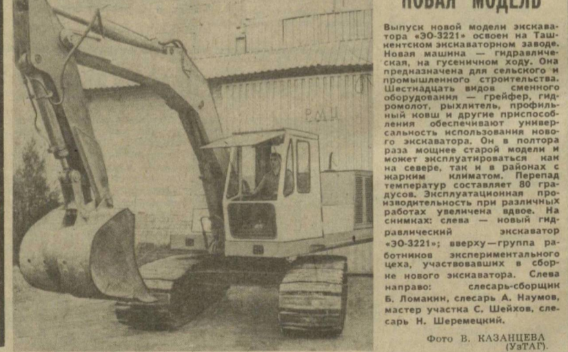
Новая модель. Выпуск новой модели экскаватора «ЭО-3221» основан на Ташкентском экскаваторном заводе. Новая машина — гидравлическая, на гусеничном ходу. Она предназначена для сельского и промышленного строительства. Шестнадцать видов сменного оборудования — грейдер, гидромолот, рыхлитель, профильный нож и другие приспособления обеспечивают универсальность использования нового экскаватора. Он в полтора раза мощнее старой модели и может эксплуатироваться как на севере, так и в районах с жарким климатом. Перепад температур составляет 80 градусов. Эксплуатационная производительность при различных работах увеличена вдвое. На снимках: слева — новый гидравлический экскаватор «ЭО-3221»; сверху — группа работников экспериментального цеха, участвовавших в сборке нового экскаватора. Слева направо: слесарь-сборщик Б. Ломанин, слесарь А. Наумов, мастер участка С. Шейхов, слесарь Н. Шеремечкин.