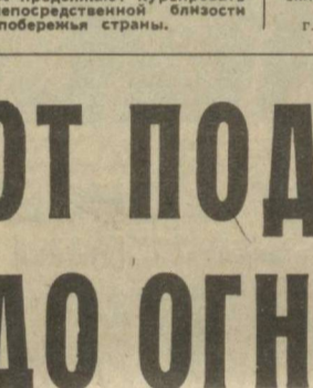
С 21 СЕНТЯБРЯ по 23 декабря 1983 года в германском городе Лейпциге шел судебный процесс по обвинению Георгия Димитрова в поджоге рейхстага (парламента). Процесс закончился полным провалом. Даже специально подобранный и натренированный состав национального суда вынужден был оправдать Димитрова и еще нескольких арестованных с ним коммунистов. 15 февраля 1934 года Советское правительство, верное своему интернациональному долгу, объявило о предоставлении трем болгарам коммунистам временного гражданства. 27 февраля они прибыли в Москву.

ПОДВИГ Г. М. Димитрова записан на скрижалях истории. Он выступал в фашистском суде, но фактически ему вменял весь мир. 25 сентября 1933 года «Правда» писала: «Колоссальная аудитория перед товарищем Димитровым, и, затая дыхание, каждое его слово слушает международный пролетариат. И как всякий боец коммунист, схваченный врагами, Димитров не думает о себе, о своей жизни, о своей безопасности. Он продолжает делать дело своей партии, зная, что не только речью своей, но и всем своим поведением он дает орудие революционной борьбы миллионам пролетариев».