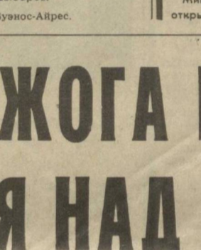
С 21 СЕНТЯБРЯ по 23 декабря 1983 года в германском городе Лейпциге шел судебный процесс по обвинению Георгия Димитрова в поджоге рейхстага (парламента). Процесс закончился полным провалом. Даже специально подобранный и натренированный состав национального суда вынужден был оправдать Димитрова и еще нескольких арестованных с ним коммунистов. 15 февраля 1934 года Советское правительство, верное своему интернациональному долгу, объявило о предоставлении трем болгарам коммунистам временного гражданства. 27 февраля они прибыли в Москву.

ПОДВИГ Г. М. Димитрова записан на скрижалях истории. Он выступал в фашистском суде, но фактически ему вменял весь мир. 25 сентября 1933 года «Правда» писала: «Колоссальная аудитория перед товарищем Димитровым, и, затая дыхание, каждое его слово слушает международный пролетариат. И как всякий боец коммунист, схваченный врагами, Димитров не думает о себе, о своей жизни, о своей безопасности. Он продолжает делать дело своей партии, зная, что не только речью своей, но и всем своим поведением он дает орудие революционной борьбы миллионам пролетариев».