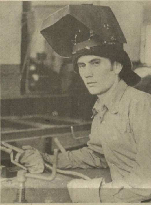
НА ЖИТЕЙСКИХ ПЕРЕКРЕСТКАХ