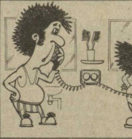
Рисунки В. МУРОМЦЕВА.