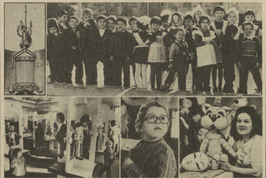
МАРШРУТЫ ИСКУССТВА — МАРШРУТЫ ДРУЖБЫ