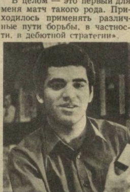
«ЗЕМЛЯ И ЛЮДИ»

«Матч явился для меня, считаю, очень большой школой и в то же время тяжелым испытанием...»