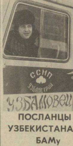
Сотни тысяч рублей капиталовложений освоили в нынешнем году узбекские строители на БАМе. Сдано 42 объекта. По итогам социалистического соревнования коллективу «УзБАМ-строй» вручено переходящее Красное знамя Читинской области.

Родным полям — полям его судьбы — Вновь в верности навеки поклоняется. И словно для того, чтобы земля поверила бы в святость этой клятвы, Он снова выйдет с плугом на поля, Едва закончится пора трудов на жатве... Так хлопкоробу жить из года в год, Но он, другого счастья не желая, На поле снова будет лить свой пот, Чтобы оно дарило урожаи!