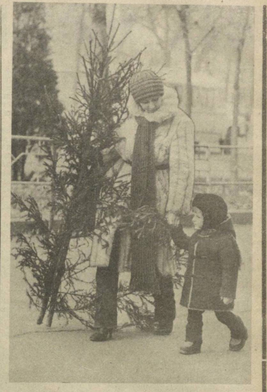
Мама, елка и я.

● ПЛАНЫ По свидетельству газеты «Нью-Йорк дейли ньюс», в настоящее время руководство США планирует изучить вопрос об использовании на постоянной основе портов и аэродромов «Гранд-Суд» по территории одного из инцидентов этого плана командующего вооруженными силами США Атлантик командования. Ставится цель превратить этот остров, оккупированный американской армией, в базу США в восточной части Карибского бассейна.