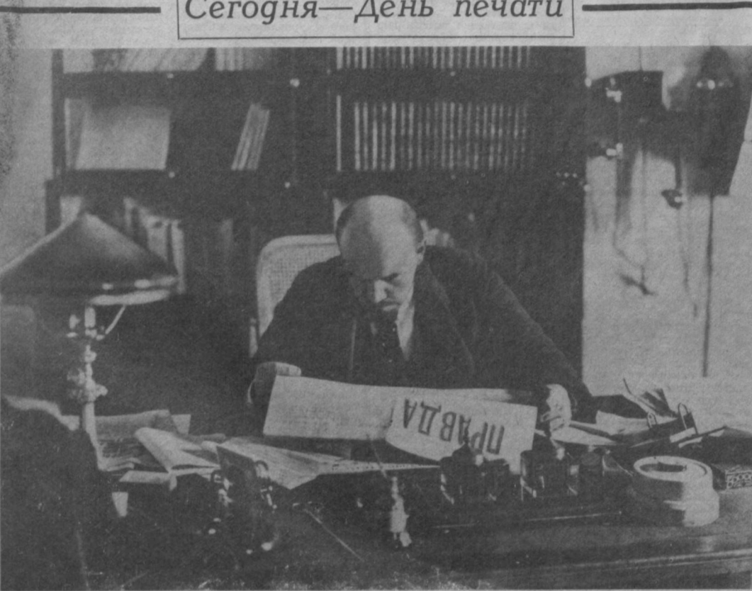
В. И. Ленин в своем рабочем кабинете в Кремле. Октябрь 1918 года.